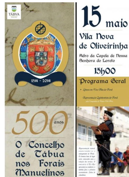
Figura 3. Cartaz de comemoração

Foi vila e sede de concelho até 1836, quando perdeu o título de vila e passou a ser uma freguesia do concelho de Midões até 1853, data em que também o concelho de Midões foi extinto, passando então a freguesia de Vila Nova de Oliveirinha para o concelho de Tábua.