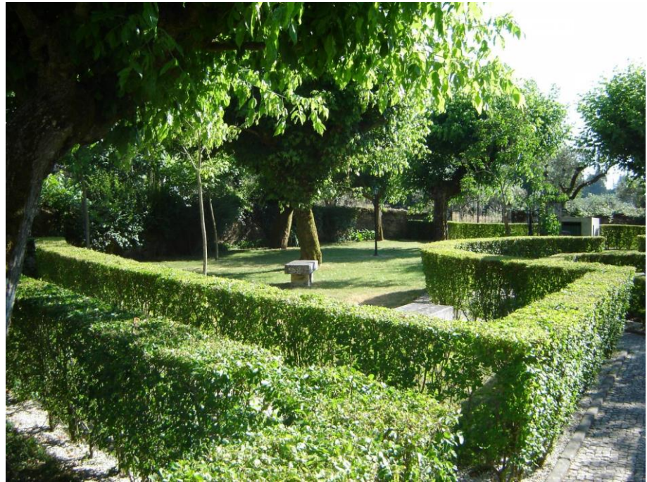
Figura 6. Jardim Monumento Grande Guerra

De planta retangular, é composto por pequenos canteiros relvados, com espécies arbóreas de médio porte, delimitados por pequenas sebes criando um pequeno labirinto. Este espaço está equipado com bancos de granito e iluminação artificial.