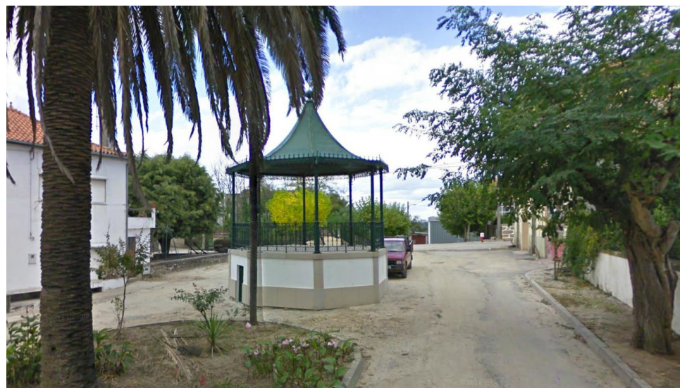
Figura 5. Avenida António Pádua

O Jardim do Monumento da Grande Guerra localizado na Rua Luiz Cândido é o grande espaço verde de utilização coletiva de Vila Nova de Oliveirinha. Como o próprio nome elucida tem no seu interior um monumento de homenagem aos combatentes da Grande Guerra.