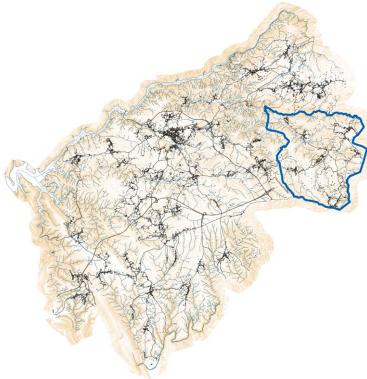
Figura 2. Limites Administrativos da União de Freguesias de Covas e Vila Nova de Oliveirinha

Apresenta uma localização estratégica, estabelecendo fortes relações económico-sociais com Oliveira do Hospital (6 km), Carregal do Sal (21 km), Seia (35 km), Arganil (32 km), Nelas (32 km), Viseu (52 km) Coimbra (77 km), e Guarda (88 km).