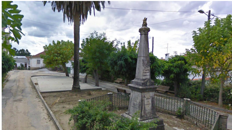
Figura 4. Avenida António Pádua